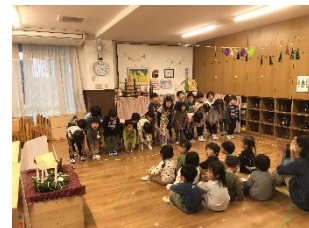
↑こりすさんに歌のプレゼント♪