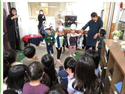
↑こぼと2組さんに「お疲れ様♡」